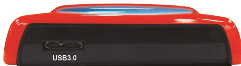
Vista da dietro